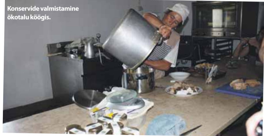
Konservide valmistamine ökotalu köögis.